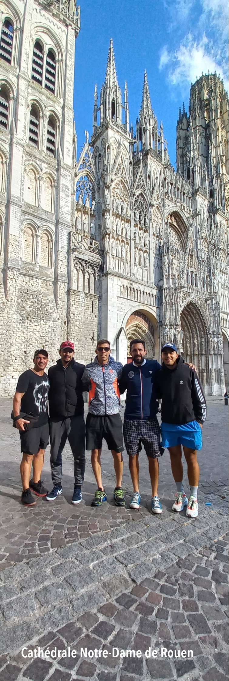
Cathédrale Notre-Dame de Rouen